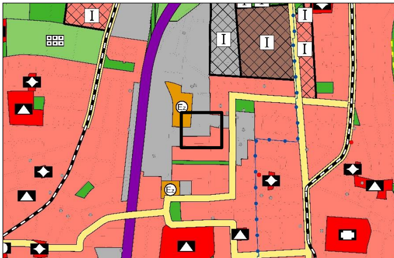
Ursprüngliche Darstellung des FNP