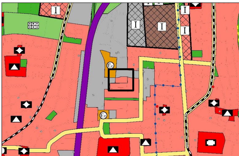
Darstellung des FNP nach Berichtigung