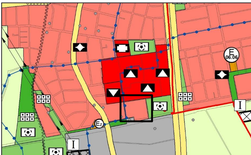
Darstellung des FNP nach Berichtigung